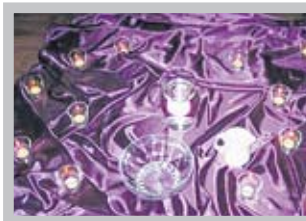
Wasser - das Symbol für Leben

Ja, zugegeben! Sie mussten wirklich recht früh aufstehen – die Teilnehmerinnen und Teilnehmer der diesjährigen FRÜHWACHEN in der Passionszeit/Fastenzeit: Um 6.00 Uhr begannen die jeweils