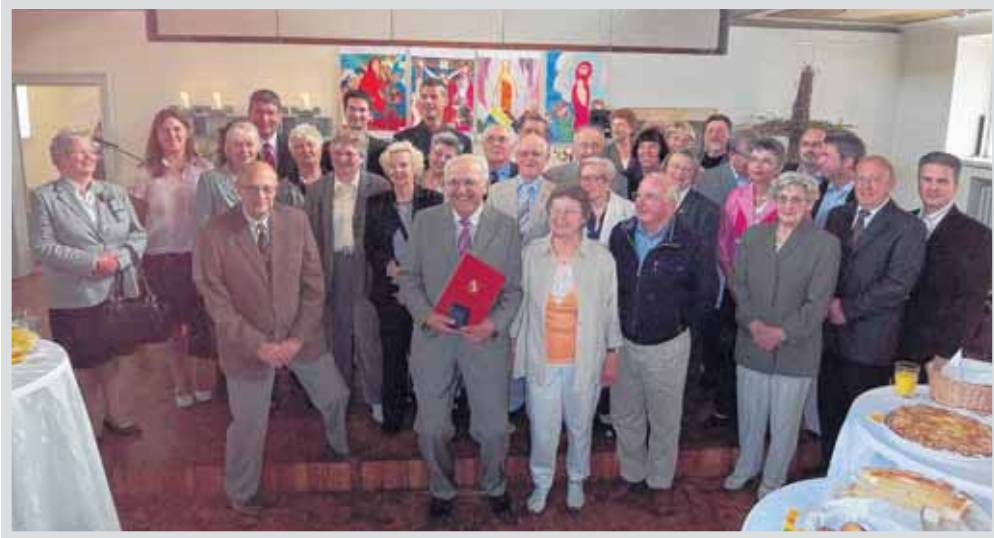
Gründungsstifter in der Friedenskirche bei der 1. Geburtstagsfeier am 31. Mai 2009

Am 31. Mai 2009 feierte die Stiftung Friedenskirche Mainz-Mombach ihr einjähriges Bestehen und beendete damit das Gründungsjahr. Zweck der Stiftung ist der Erhalt der Mombacher Friedenskirche mit ihren Kunstwerken, mit Orgel und Glocken und all dem, was sie uns kostbar und liebenswert macht. Dazu gehört auch das Leben in der Kirche, wie z. B. die Förderung der Kinder-, Jugend- und Seniorenarbeit.