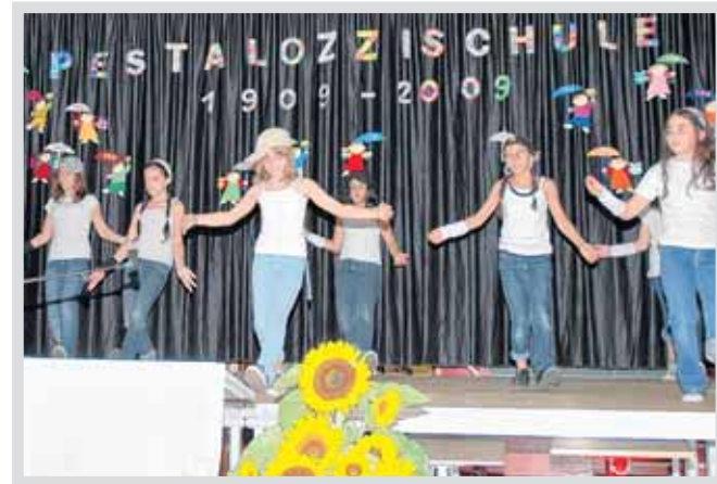
Die Musik AG und SKG führten einen Tanz auf.

vor 76 Jahren als Erstklässler zur Pestalozzischule ging und bei dem Festakt seine ganz persönlichen Schulerlebnisse schilderte: „120 Jungen und Mädchen kamen mit mir in die Schule. Das Lesebuch, die Fibel, war das gleiche wie es meine Mutter als Erstklässlerin im Jahr 1902 hatte.“ Die Schüler kratzten mit Schiefergriffeln auf Schiefertafeln und