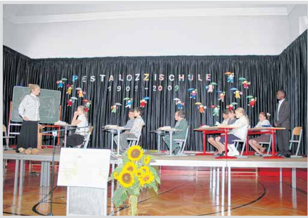
Die Theater AG zeigte, wie es vor 100 Jahren in der Schule zugeht.