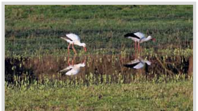
Unser Ziel - so soll es einmal aussehen

Spendenkonto 100 20 48 38, Genobank Mainz e.G. BLZ 550 606 11