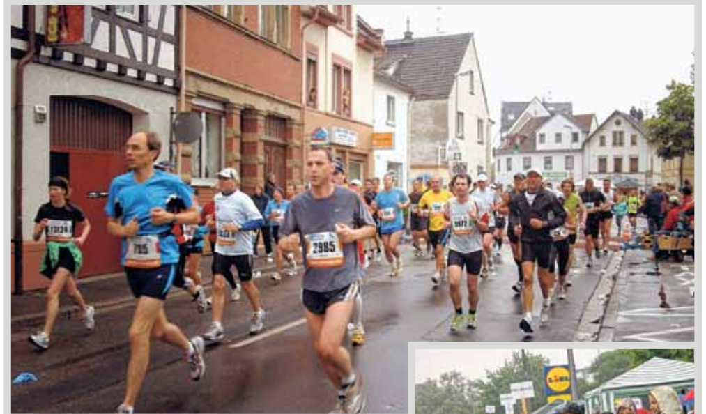
Läufer beim Passieren der Hauptstraße in Höhe der Mombacher Ortsverwaltung

Ein Gutenberg Marathon verlangt nicht nur den Läufern, sondern auch den ehrenamtlichen Helfern viel ab. Organisation und Vorbereitung für die Zuschauerunterhaltung an der Ortsverwaltung brauchen bereits viele Helfer. An Ort und Stelle beim Marathon braucht es noch mehr gute Geister. Bei schönem Wetter ist der Ansturm an der Verpflegungsstation