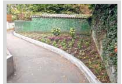
Nachher – Mit neuer Bepflanzung

Helfen auch Sie, dass wir ein lebens- und liebenswertes Mombach – ein schöneres Mombach – erhalten.