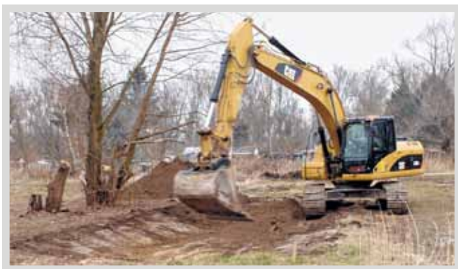
Bagger sorgen für den Aushub der Teiche

Unterstützt durch JUWÖ Poroton aus Wöllstein und das Mainzer Bauunternehmen WK Kaufmann beginnt die Abdichtung der Teiche, die neuen Lebensraum für Frösche, Kröten und Molche bieten soll. Auch Insekten und die Störche, die am Rheinufer zwischen Mombach und Budenheim brüten, sollen von dieser Maßnahme profitieren. Auf den Wiesen des Vereins, die mit Unterstützung zweier Stiftungen erworben wurden,