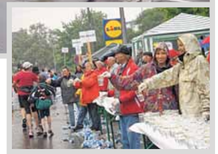
Gut gelaunte MTV-Helfer am offiziellen Verpflegungsstand

in der 1. Runde oft so groß, dass man beim Auffüllen und Verteilen der abertausenden Becher mit Wasser nur mit Mühe einmal den Blick von Wassertonnen und Bechern heben kann, um den Läufern ein aufmunterndes Lächeln zu schenken. Trotzdem bleibt Zeit für anfeuerndes Klatschen und Zuspruch für müde Beine. Den eigenen Rücken und seine Arme spürt man nach einem solchen Einsatz noch Tage später. Auch wenn bei strömendem Regen, wie in diesem Jahr, die Nachfrage nach Wasser geringer war, so fordert es echten Einsatz und wahren Sportsgeist