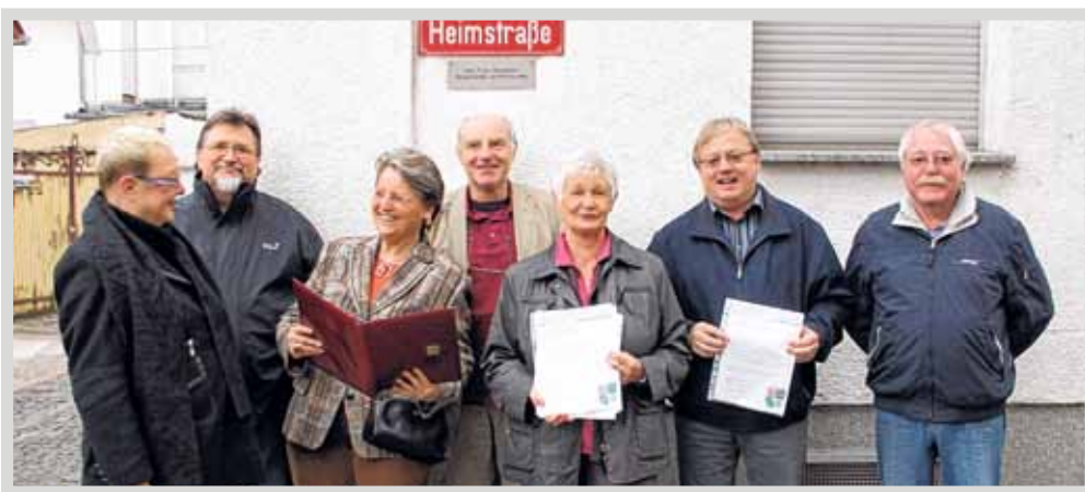
Vorstand und Sponsoren bei der Vorstellung der Straßenzusatzschilder

Vielleicht sind sie Ihnen schon aufgefallen, die neuen Zusatzschilder an den Straßennamensschildern im Mombacher Ortskern. Welche Personen verbergen sich hinter den Straßennamen? Auskunft darüber sollen die zusätzlich angebrachten Informationsschilder geben.