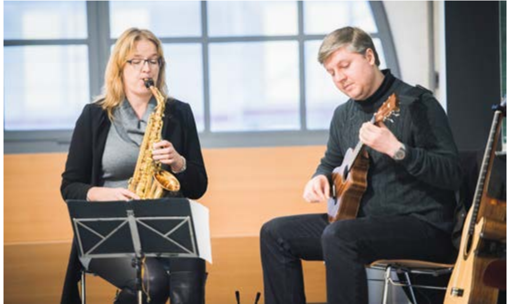
Duo ChordAer