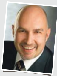
Peter W. Vollmer Rechtsanwalt

den Unwirksamkeit. Mit dieser Rechtsprechung denkbar sind daher reine Reservierungsverträge, wobei allerdings nach herrschender Auffassung die Gebühr 10 bis 15 Prozent einer üblichen Maklerprovision nicht übersteigen darf. Als Kombination aus Maklervertrag und Reservierungsgebühr bestehen aber nach wie vor die bereits dargestellten Wirksamkeitsbedenken.