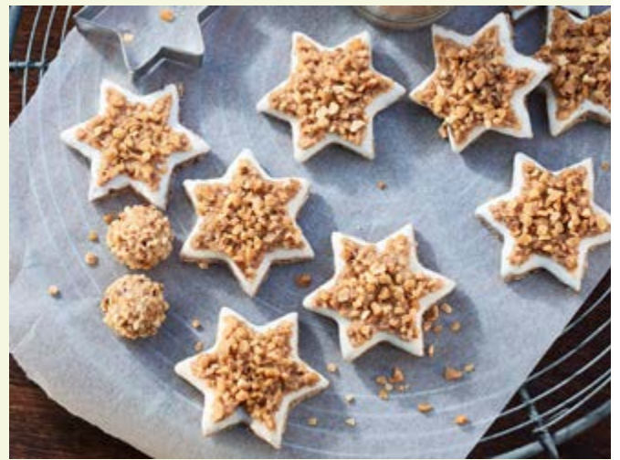
Wie das duftet - Zimtsterne sind ein unverzichtbarer Klassiker!

Als Erstes die Eiweiße mit Salz steif schlagen. Puderzucker sieben und nach und nach unterschlagen. Ein Drittel Eischnee beiseitestellen und den übrigen Eischnee mit 300 Gramm Nüssen,