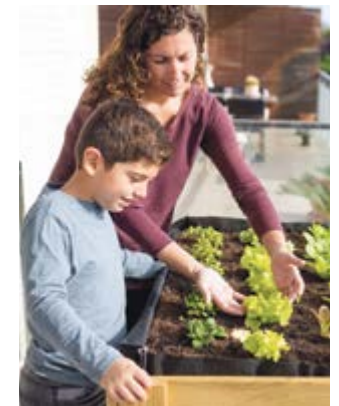
Besonders beliebt sind Hochbeete aus Holz. Von innen sollte das Hochbeet aus Holz mit Folie ausgekleidet werden.

Paprika, Radieschen, Tomaten, Wintersalat, Gurke und Zucchini. Erhältlich ist die Holzbox unter www.saatgut-dillmann.de .