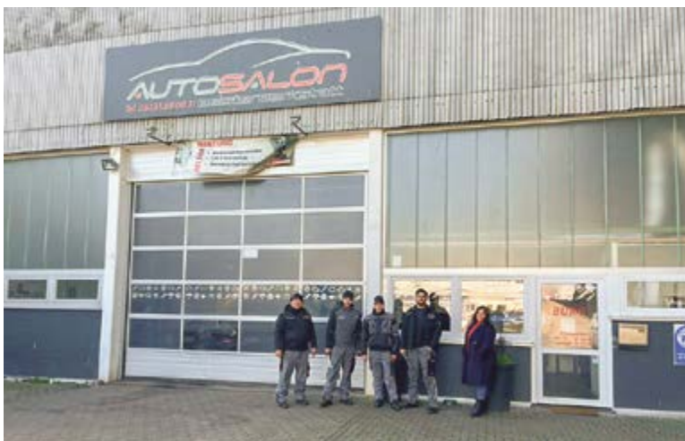
Das erfahrene Meister-Team sorgt für Ihre Mobilität

Viele begeisterte Kunden freuen sich, für Ihr Fahrzeug einen festen Ansprechpartner zu haben, der ihr Fahrzeug kennt.